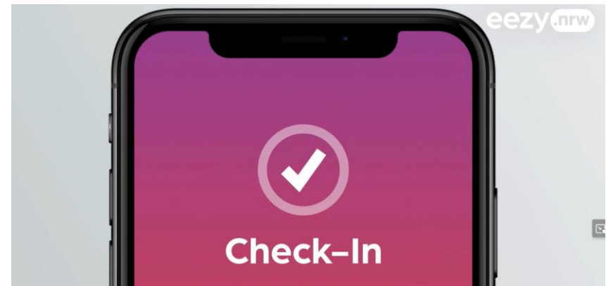
moBiel – eezy.nrw